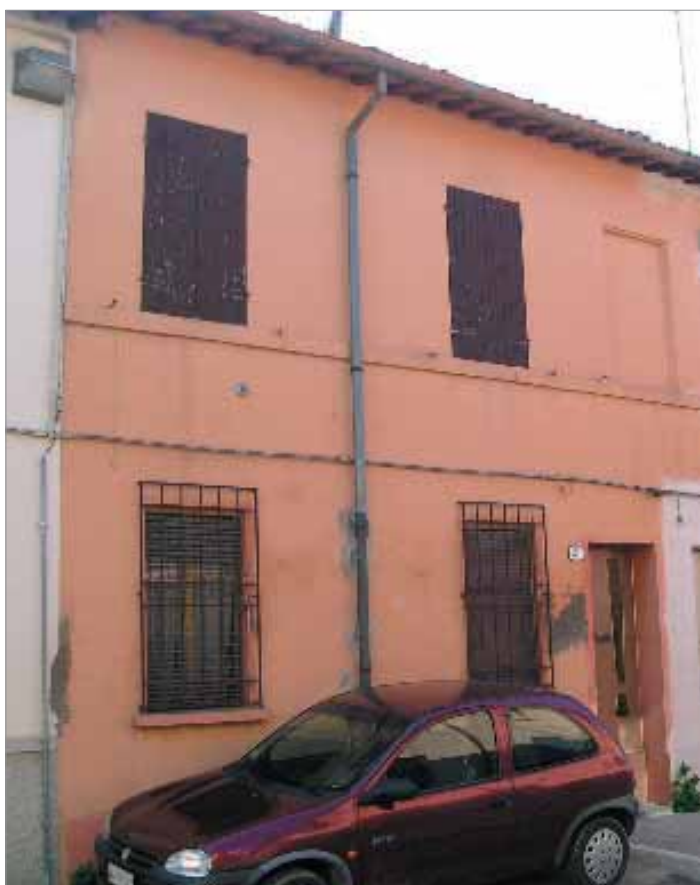
Via Verdi 21 Fronte Principale